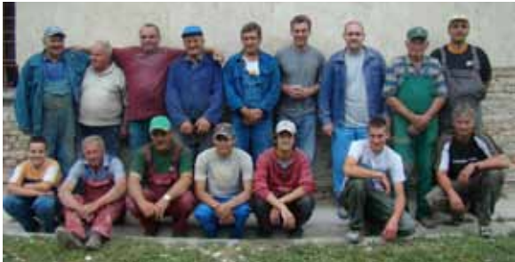
Gemeindeglieder bei der Kirchenrenovierung.

Bei meinem ersten Besuch im Juni dieses Jahres in Győrújbarát im Nordwesten Ungarns hatte die evangelische Kirche noch einen recht desolaten Eindruck gemacht. An verschiedenen Stellen lagen die Wände bzw. das Mauerwerk offen, die Ziegel waren alt und z.T. marode. Auch innen lagen große Teile